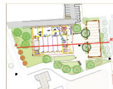
COUPE ÉLÉVATION DE PRINCIPLE A-A'