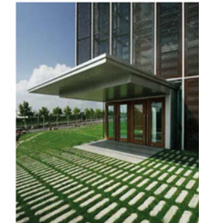
Dalle béton / gazon